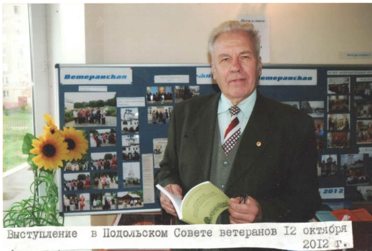
Выступление в Подольском Совете ветеранов 12 октября 2012 г.