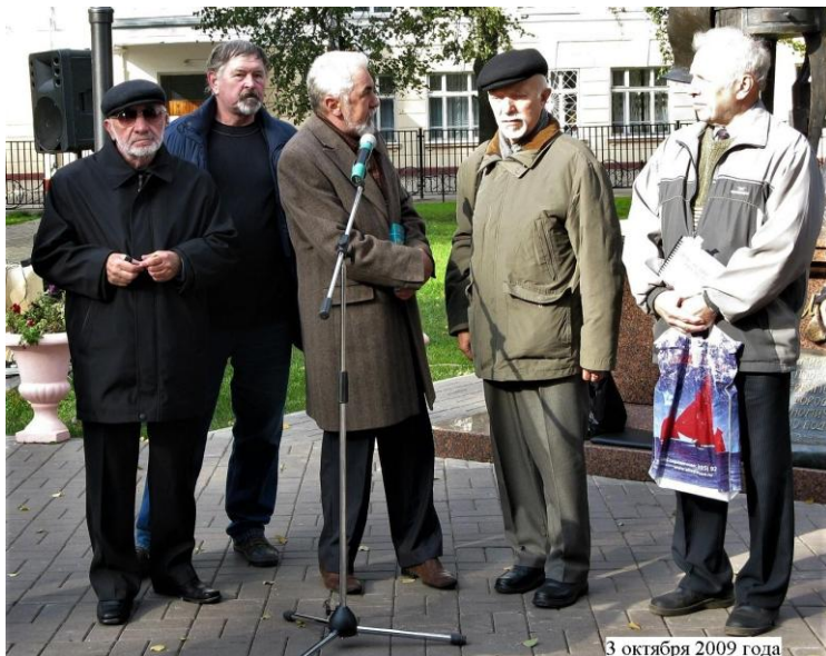
3 октября 2009 года